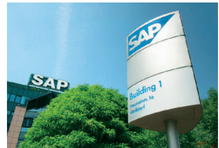
Firmensitz in Walldorf: Auch hier stimmt das außerbilanzielle Umfeld – SAP ist Dritter.

nehmen oder Dritte publizieren“, erklärt Dürndorfer. Doch ihre Analysten haken auch nach, wenn sie Angaben vermissen.