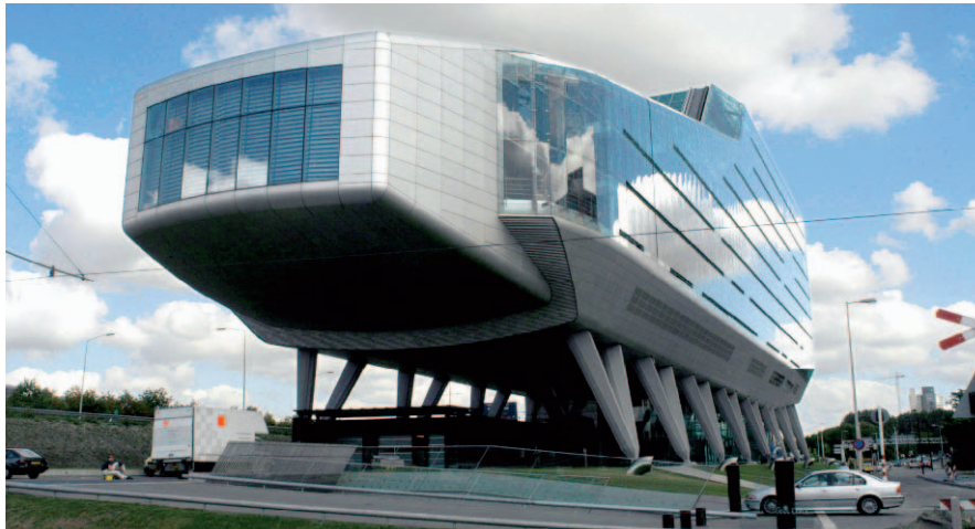
ING-Zentrale: Die Amsterdamer sind mit ihrem Raumschiff laut dem Ranking bestes Euro-Stoxx-Haus.

Langfristig sind für Aktienkurse neben Finanzzahlen gerade immaterielle Kriterien entscheidend. BÖRSE ONLINE präsentiert eine entsprechende Analysemethode und ihr Euro-Stoxx-50-Ranking.