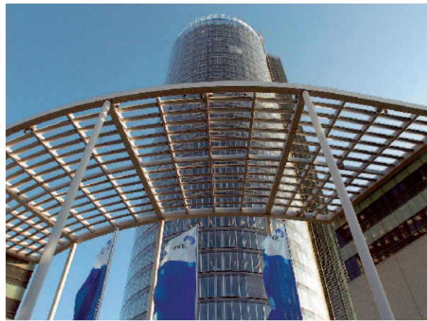
RWE-Sitz in Essen: Beim Extra-Financial-Ranking trägt der Stromversorger die rote Laterne. Laut der Analyse besteht viel Verbesserungspotenzial.

Auch beim vierten Punkt Corporate Governance, also gute Unternehmensführung, haben die deutschen Konzerne Potenzial: Hier liegen sie vor allem wieder hinter denen aus den Beneluxgebieten und aus Holland – siehe Musterknabe ING im Interview – im Mittelfeld. So zeigt RWE, Schlusslicht im Rating, laut Dürndorfer Schwächen: „Der Aufsichts-