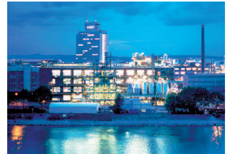
BASF in Ludwigshafen: Deutschlands bester „Extra-Financial“-Riese belegt im Euro Stoxx Rang zwei.